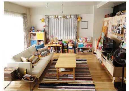
2017年7月TBS系 「カンナさーん！」から