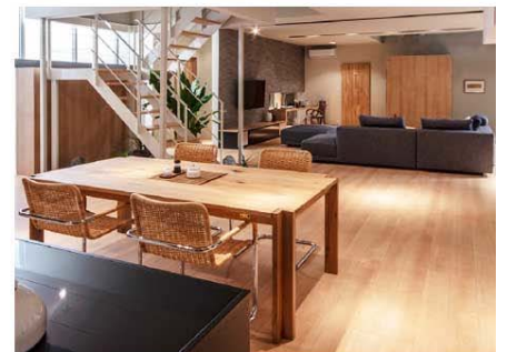
2018年10月TBS系 「大恋愛～僕を忘れる君と」から