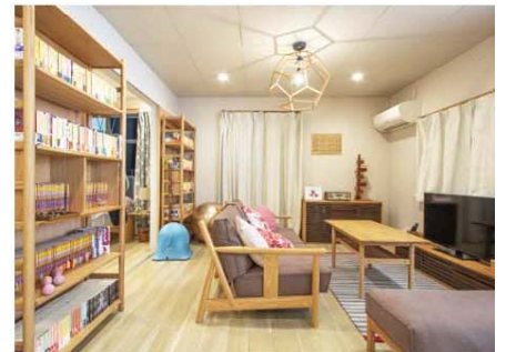
2019年4月日テレ系 「あなたの番です」から