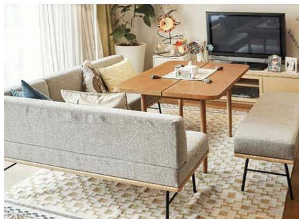
2018年1月テレ朝系 「ホリデイラブ」から