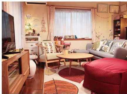
2017年1月日テレ系 「スーパーサラリーマン左江内氏」から