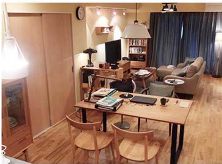
2016年10月TBS系 「逃げるは恥だが役に立つ」から