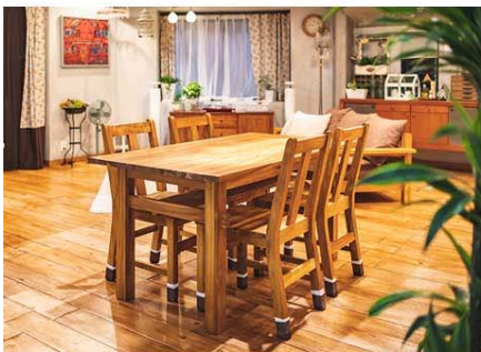
2017年7月日テレ系 「過保護のカホコ」から