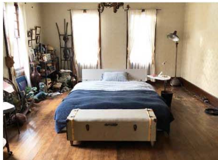
2019年4月TBS系 「インハンド」から