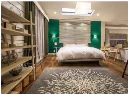
2018年7月日テレ系 「高値の花」から