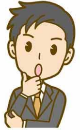
東京都健康安全研究センター担当者

基本的には、金属製の水筒であっても内部にコーティングが施されている製品がほとんどですので、スポーツドリンクを入れたからといって金属が溶け出すことはほぼないと考えています。類似の中毒事例の報告は近年はほとんどありません。おそらく、2008年の事例が最後と思われる。