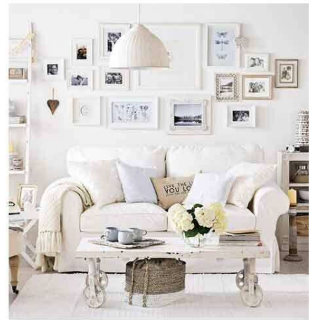
これはキャンドルは無いけれど、シャビーシックなお部屋。壁のデコレーションやソファのクッションを盛り盛りでインパクト&華やぎ。