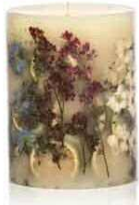
ボタニカルキャンドル