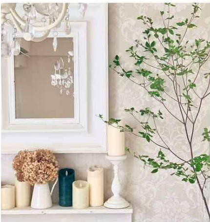
白とベージュでまとめたおしゃれなインテリア。ミラーに写りこむシャンデリアも計算されて…？アクセントのネイビー色キャンドルも○