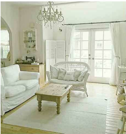
これはキャンドルは無いけれど、シャビーシックなお部屋。ファブリックは総て白で統一。シャンデリアで一気に格調アップ。

「シャビー」は白を基調としたアンティーク調の家具やインテリアのスタイルを指すカタカナ語。英語のシャビー（みすぼらしい）とシック（上品）をかけ合わせたミックススタイル。アンティークや使い古した雑貨を使い、上品で温かみのあるテイストが基本です。中でも、秋の夜長をイメージするような、「キャンドル使い」を中心にチョイスしてみました。