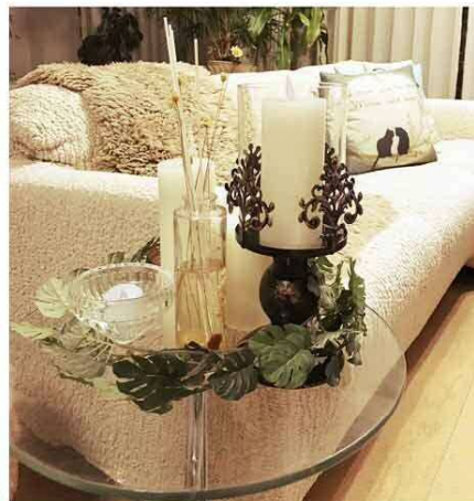
凝ったキャンドルホルダーに映える白いキャンドル。ラタンスティックのアロマデュフューザーとも良い相性ですね。