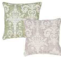
ダマスク柄クッション