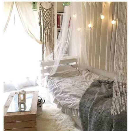
ローテーブルの上にカンテラひとつ。それだけでぐっと雰囲気アップの寝室。白、ベージュ、グレーの統一感が素敵。