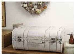
トランクボックス