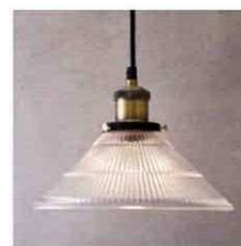
ビンテージペンダントランプ