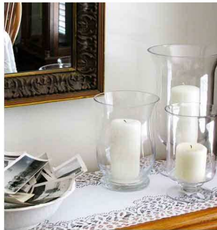
曲線がきれいな、種類が異なるガラス瓶にキャンドルを入れても様になるのは口の形が同じだから。ボウルに入れた写真も○